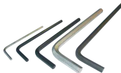
Chiavi a L esagonali