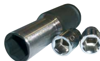
Chiave a pipa esagonale