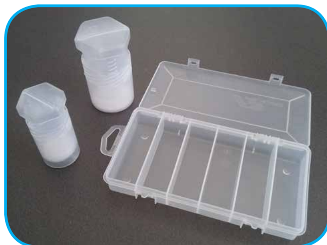
Contenitori per inserti