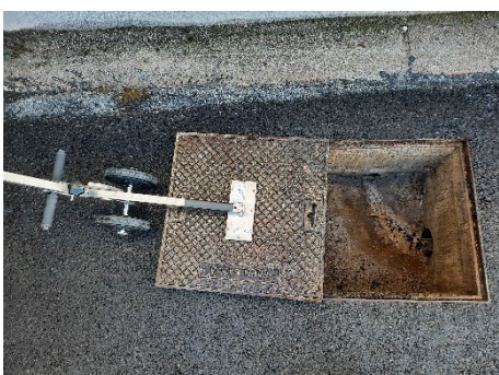
Quando il coperchio è sollevato e stabile, allontanarlo dal pozzetto...