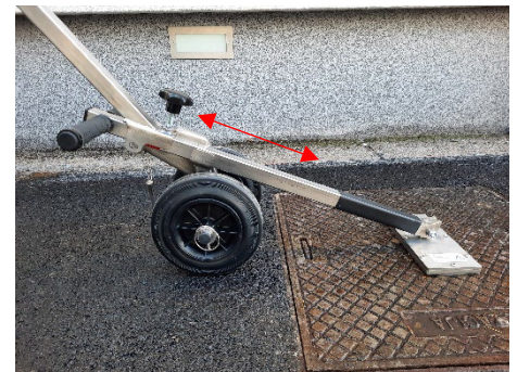
Impostare la posizione dell'adattatore in modo che le ruote siano saldamente appoggiate su una superficie solida accanto al coperchio.