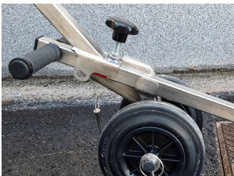
Abbassare l'adattatore in modo che si "appoggi" sulla maniglia del Mr. Olimpia.