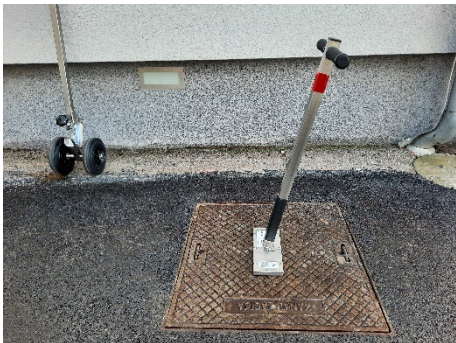
Installare Mr. Olimpia sul chiusino

L'adattatore su ruote ( 5400.25-03C ) è destinato all'uso con l'alzatombini magnetico Mr. Olimpia. L'adattatore consente di sollevare chiusini facendo leva con il proprio peso. In questo modo si evita di affaticare la colonna vertebrale.