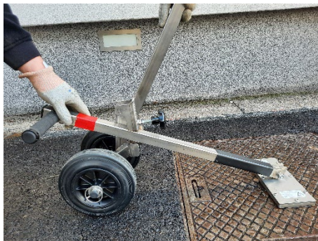
Avvicinare l'adattatore all'impugnatura del Mr. Olimpia con un'angolazione tale da consentire di collegare l'adattatore al Mr. Olimpia.