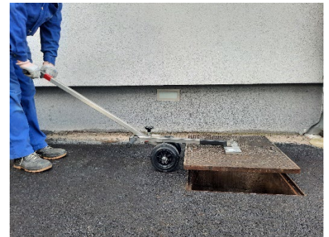
Sollevare il coperchio spingendo la leva verso il basso.