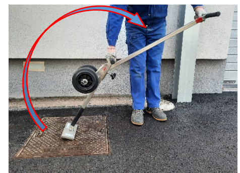
Il Mr. Olimpia e l'adattatore possono essere rimossi dal chiusino ruotando l'assieme nella direzione indicata in figura fino a scollegare il magnete.

Seguire tutte le istruzioni di sicurezza per l'alzatombini magnetico Mr. Olimpia quando si lavora con l'adattatore. Utilizzare un equipaggiamento protettivo adeguato (scarpe di sicurezza, guanti).