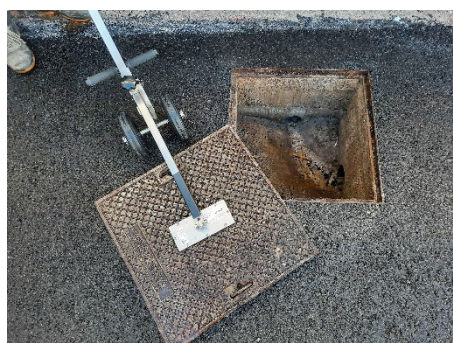
... o ruotarlo intorno all'asse delle ruote. Fare attenzione a non spingere le ruote verso l'apertura dell'albero!