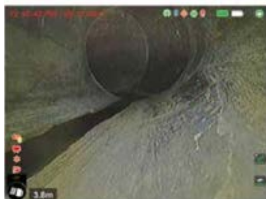
IMMAGINE CON HDR & TiltSense