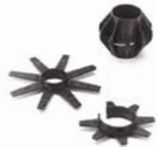
Set di guide di centraggio 30 mm in dotazione con la ruota Mini SeeSnake