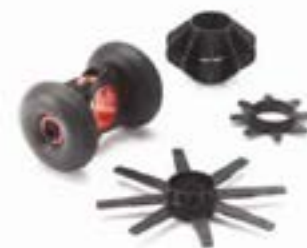
Set di guide di centraggio 35 mm in dotazione con la ruota SeeSnake