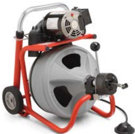
Stasatrice K-400 con AUTOFEED®