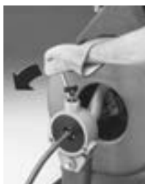
Avanzamento del cavo