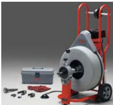
Stasatrice K-750 con C-100 sopra raffigurato