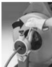
Ritorno del cavo